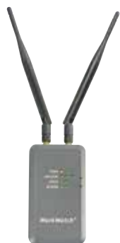
※写真は標準添付のアンテナと別売アンテナを取り付けています。