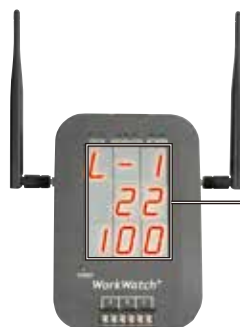
※写真は標準添付のアンテナと別売アンテナを取り付けています。